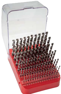
Spiralbohrerset in Werkstattständer