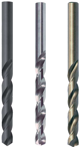
HSS-R HSS-G HSS-G Co 5