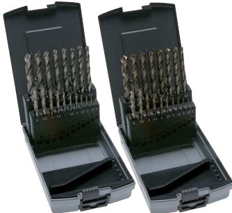
Spiralbohrerset (HSS-G & HSS-G Co 5)